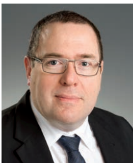
Par Christian Scholly Rédacteur en chef